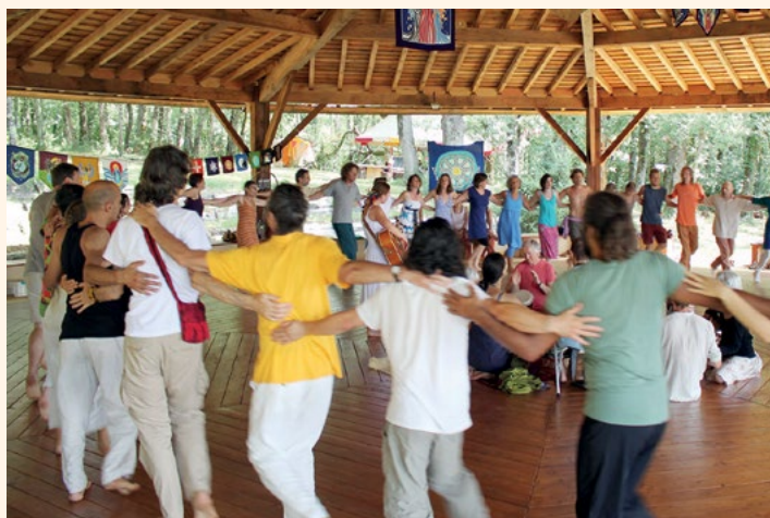
Danses de la Paix Universelle au camp d'été 2016