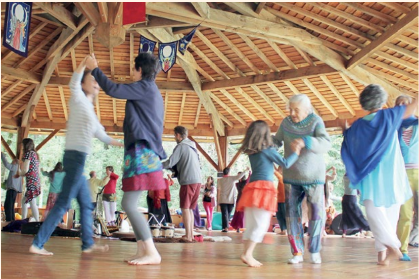
Danses de la Paix Universelle au camp d'été 2016